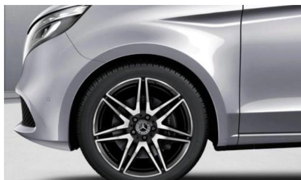
Bremsättel mit Mercedes-Benz Schriftzug - (BS1)