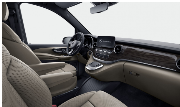
Leder Nappa seidenbeige - (VY9)