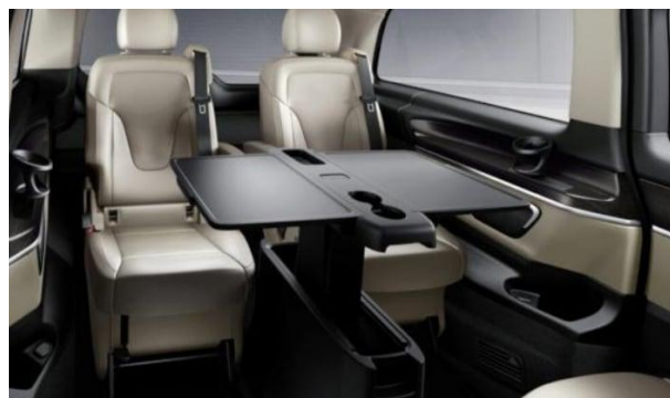
Tisch-Paket - (V9A)