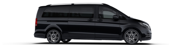
obsidianschwarz metallic - (9197)