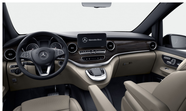
Zierelemente Holzoptik Ebenholz, dunkelanthrazit - (FH9)