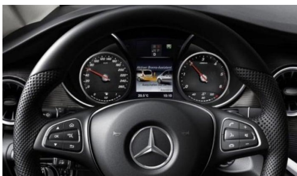
Aktiver Brems-Assistent - (BA3)