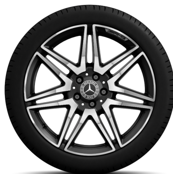
AMG Leichtmetallräder 8 J x 19, glanzgedreht - (RK4)